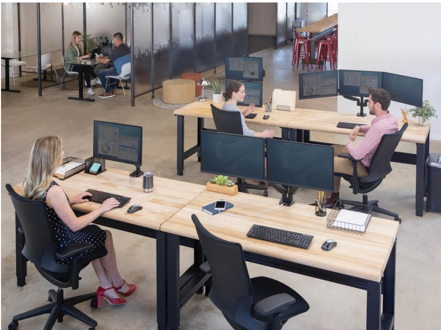
BU 2: Fellowes Monitorarme der vielseitigen Platinum Serie eignen sich für den Einsatz im klassischen Firmenbüro sowie im Coworking Space